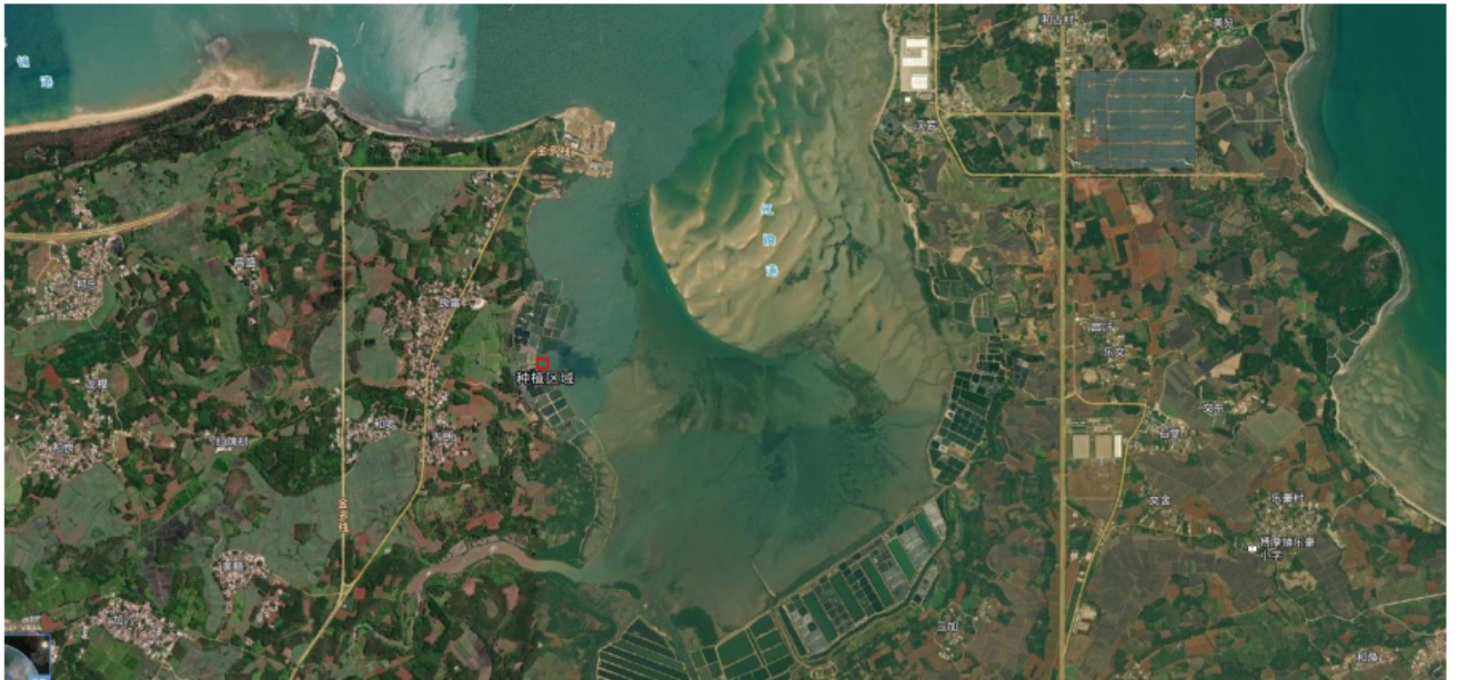
图 1-3 种植区域卫星图