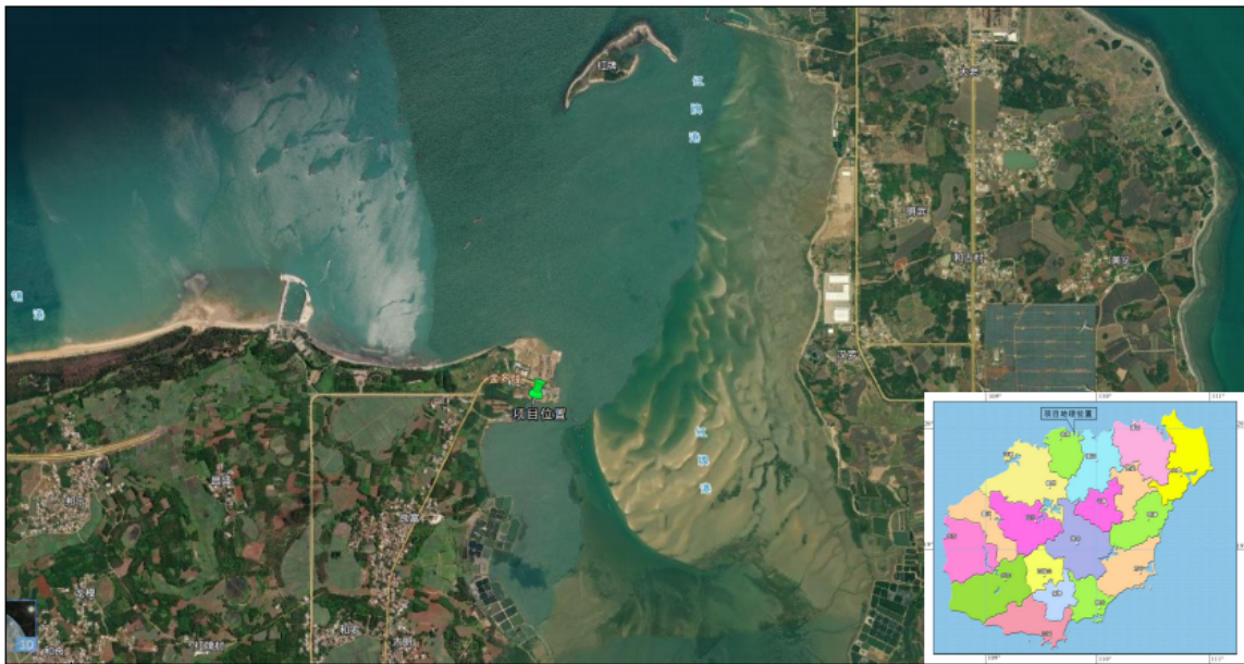
图 1-1 项目地理位置图

海南金牌港船舶修造厂围填海项目位于海南省临高县金牌港经济开发区的西北部，北临琼州海峡，距海南省会城市海口市 60km，距洋浦港 60km，距临高县城 12km。项目用地 80.37 亩，占用岸线长 650m，项目建成后岸线增加到 1290m，项目地理位置图见图 1-1。