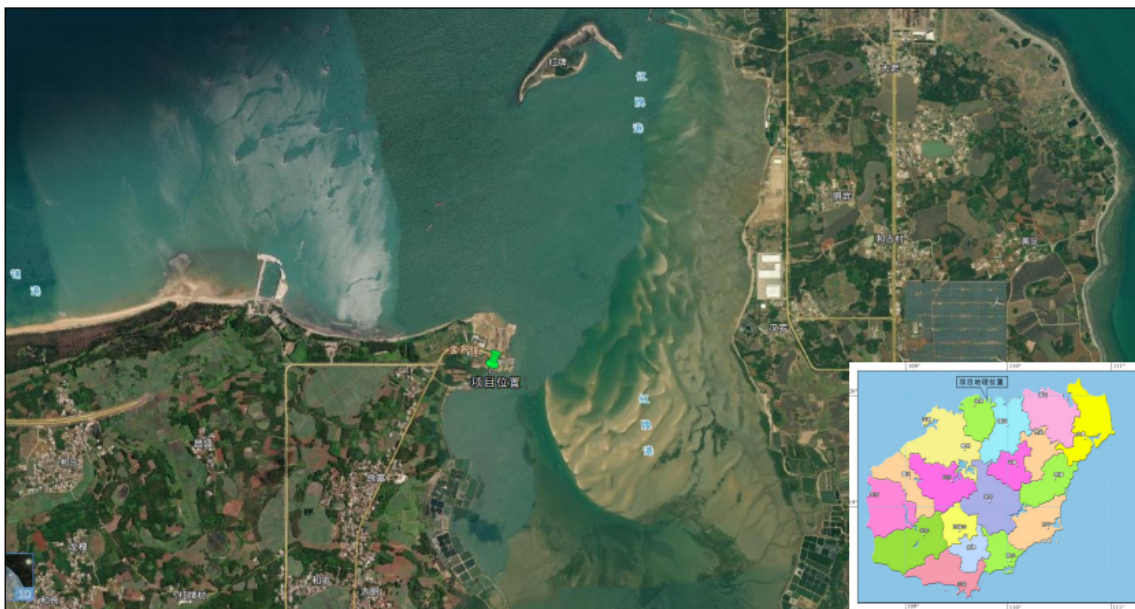
图 1-1 项目地理位置图

海南金牌港船舶修造厂围填海项目位于海南省临高县金牌港经济开发区的西北部，北临琼州海峡，距海南省会城市海口市 60km，距洋浦港 60km，距临高县城 12km。项目用地 80.37 亩，占用岸线长 650m，项目建成后岸线增加到 1290m，项目地理位置图见图 1-1。