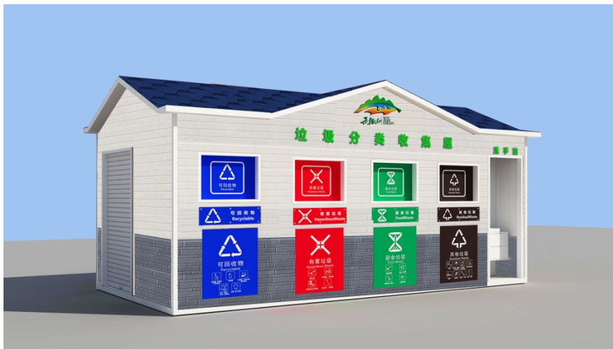
(长 6 米*宽 2.91 米*高 2.95 米，总面积 17.46m 2 )