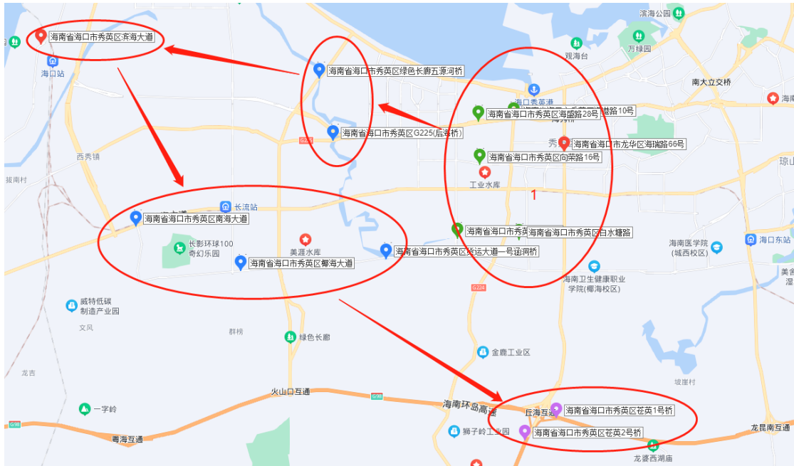
图 3 秀英区桥隧分布图