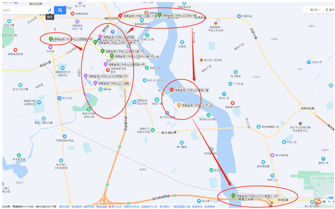
图 4 琼山区桥隧分布图