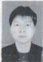
(加盖公章机关印有效) Valid with embossed seal