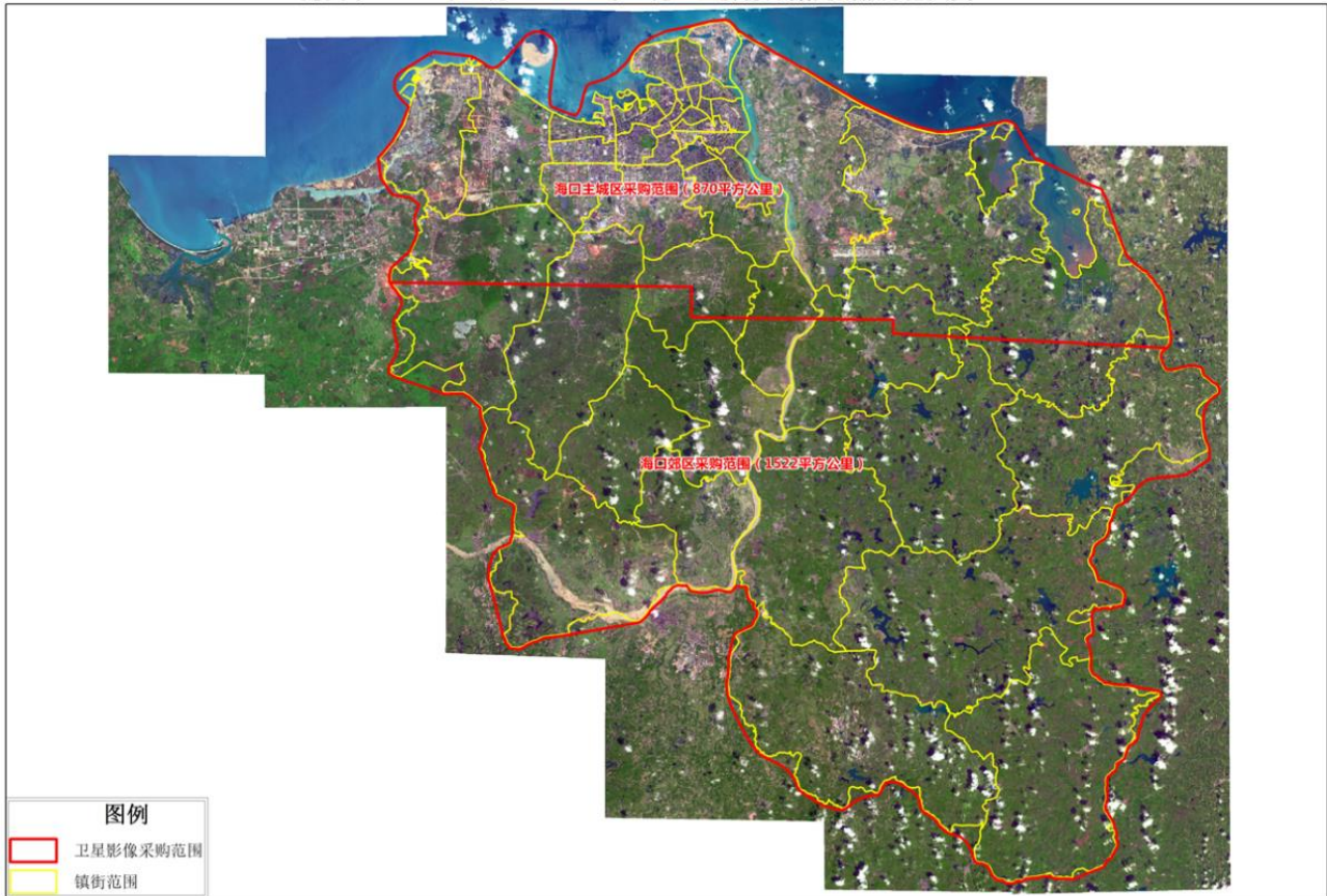
海口市 2024 年卫星影像数据更新服务范围示意图

2.1.2按采购人要求利用不同时期影像数据比对提取变化图斑（具体的图斑提取及形状绘制要求按采购人制定的标准执行）。